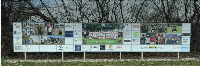
Logoplatzierung auf der Sponsorentafel bei der Driving Range