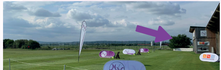
Werbefahle direkt auf der Driving Range - ab 2026!