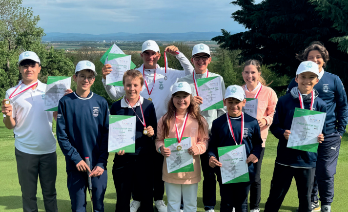
Betreuung von mehr als 50 Turniere durch unsere Pros