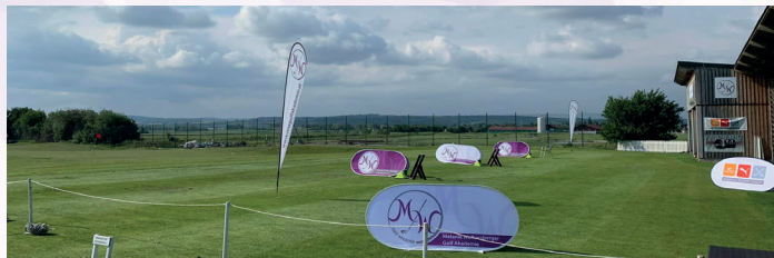
Logoplatzierung mit Beachflag auf der Driving Range

Website der MW Golf Akademie und DCC Juniors inkl. Verlinkung (Fußzeile und Sponsorenseite)